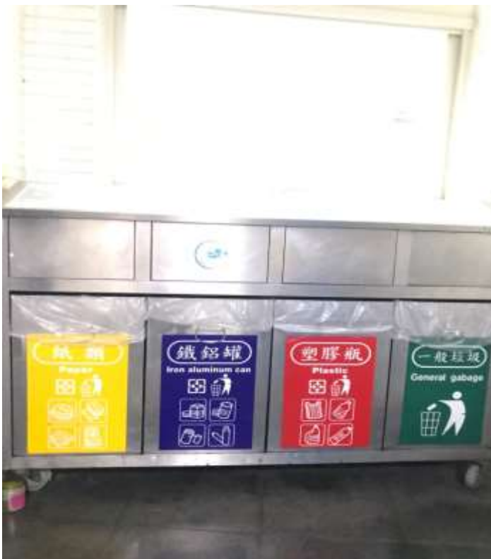
各大樓、各樓層皆設置資源回收箱回收紙類、鐵鋁罐、塑膠瓶一般垃圾