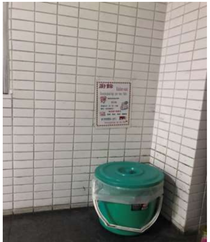
定點設置廚餘回收桶，回收吃剩飯菜廚餘等供養豬戶集中再利用